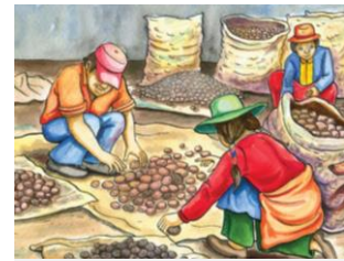
Seleccione semilla sana para no llevar polilla a su parcela

Lleve la papa rápidamente del campo al almacén. Si la deja en el campo, tápela con un toldo, para que no entre la polilla.