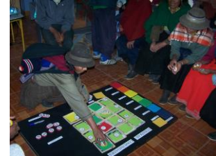
Una tabla con 16 celdas representa el daño de las polillas en campo