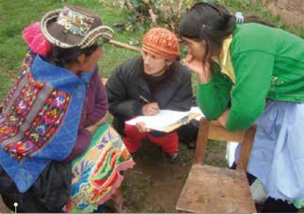
Encuestas de 24 horas.